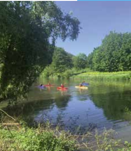
Schirmherrin Ricarda Funk, Olympiasiegerin Kajak Slalom 2021, Weltmeisterin Kajak Slalom 2021